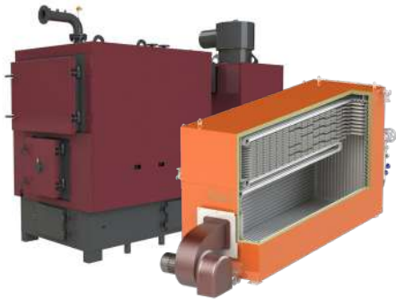
котли (газ, тверде паливо)

— це виробництво, яке закриває повний цикл від котла до готової котельні.