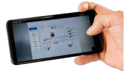
автоматизація та сервіс